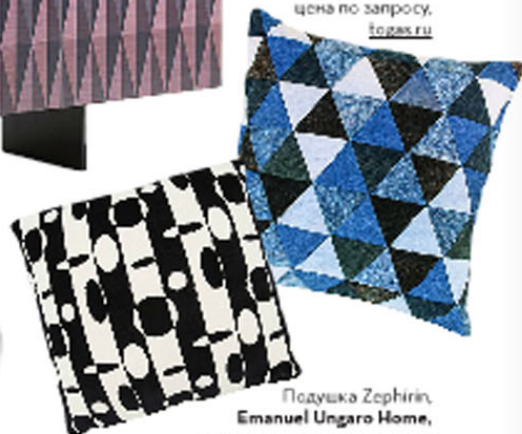
Подушка Zephirin, Emanuel Ungaro Home, цена по запросу, ungarohome.com

Подушка, Togas, цена по запросу, togas.ru