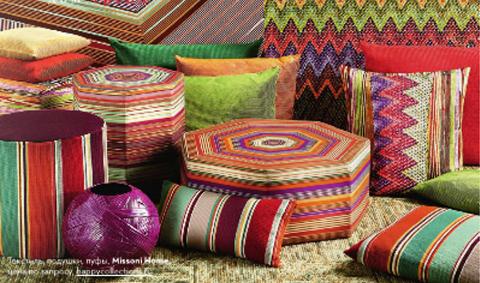
Текстиль, подушки, пуфы, Missoni Home, цена по запросу, bazaroolectra.ru