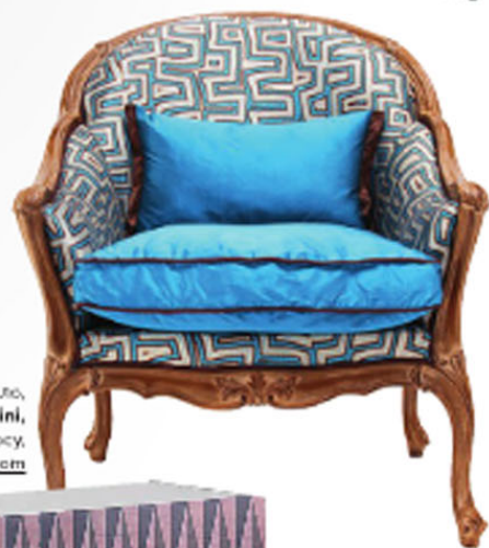
Кресло, Roberto Giovannini, цена по запросу, robertogiovannini.com

Подушка, Togas, цена по запросу, togas.ru