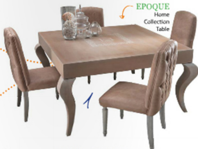
EPOQUE Home Collection Table

Обеденная зона – главное место встречи семьи и друзей, поэтому предметы мебели в ней обязаны производить приятное впечатление, благодаря своему интересному дизайну и комфорту.